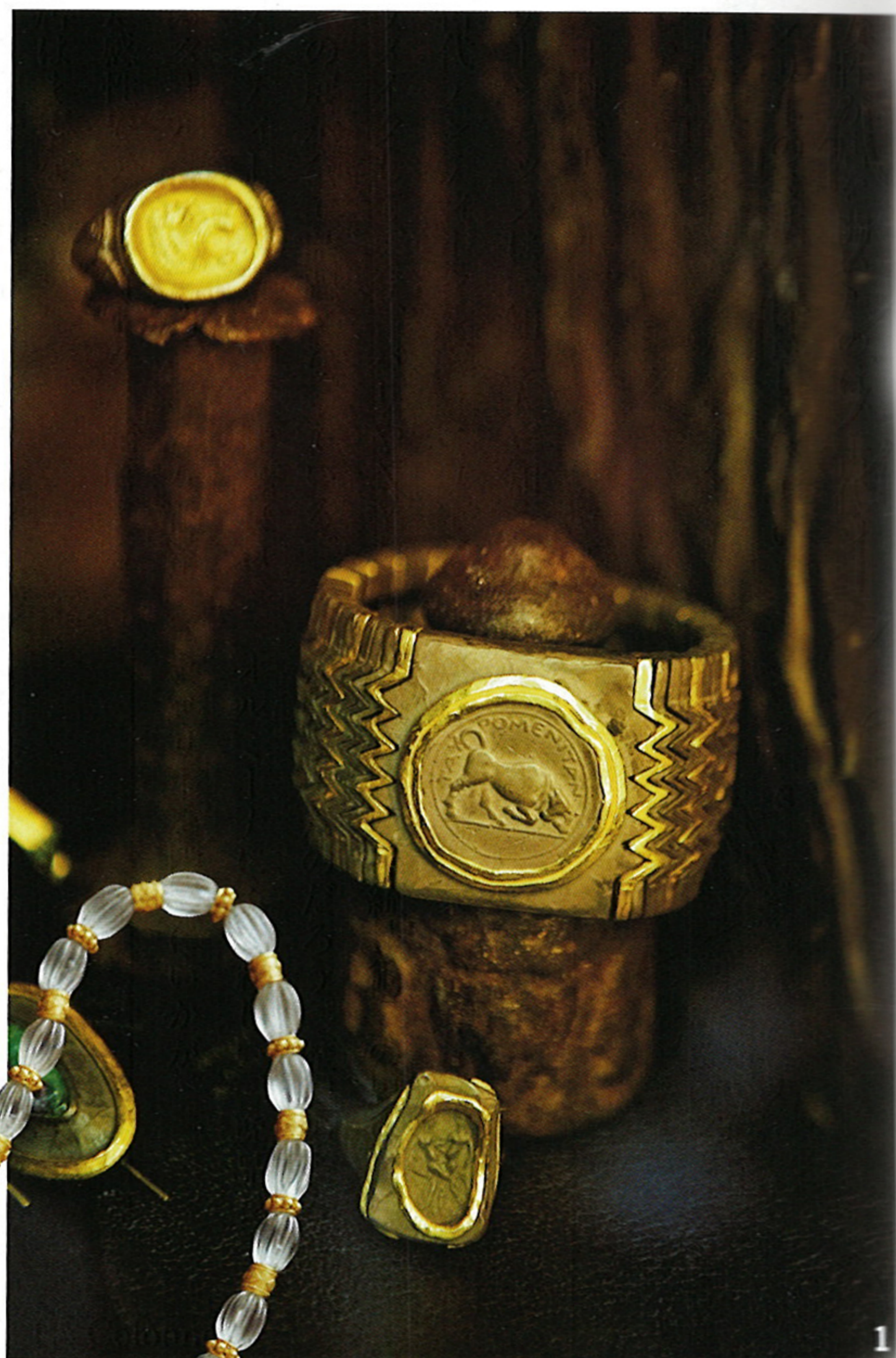
1.古代コインのジュエリーは中世にはじまり、現在ブラザリアなども作るが、この店では全体を伝統的な技術で作ることにこだわる。2.19世紀のゼウスのペンダント。古代の技法を甦らせた、パートド・ヴェールのゼウス。€6,800 3.アレキサンダー大王の甲冑の技法で作ったバングル€16,000。矢じり形ピアス€2,600

1坪ほどの小さな小さなジュエリーショップは、知る人ぞ知る店。古代アンティークをジュエリーにリメイクして、今、パリやNYなどの展示会で話題になっている。アンティークショップが軒を連ねるタオルミーナでも、こんな洒落た感性でアンティークを発信する店はまずない。 ジュエリーの修復士だった2人の女性が店を開いたのは、古代ジュエリーの技法を保持したいというのがきっかけだった。2人とも